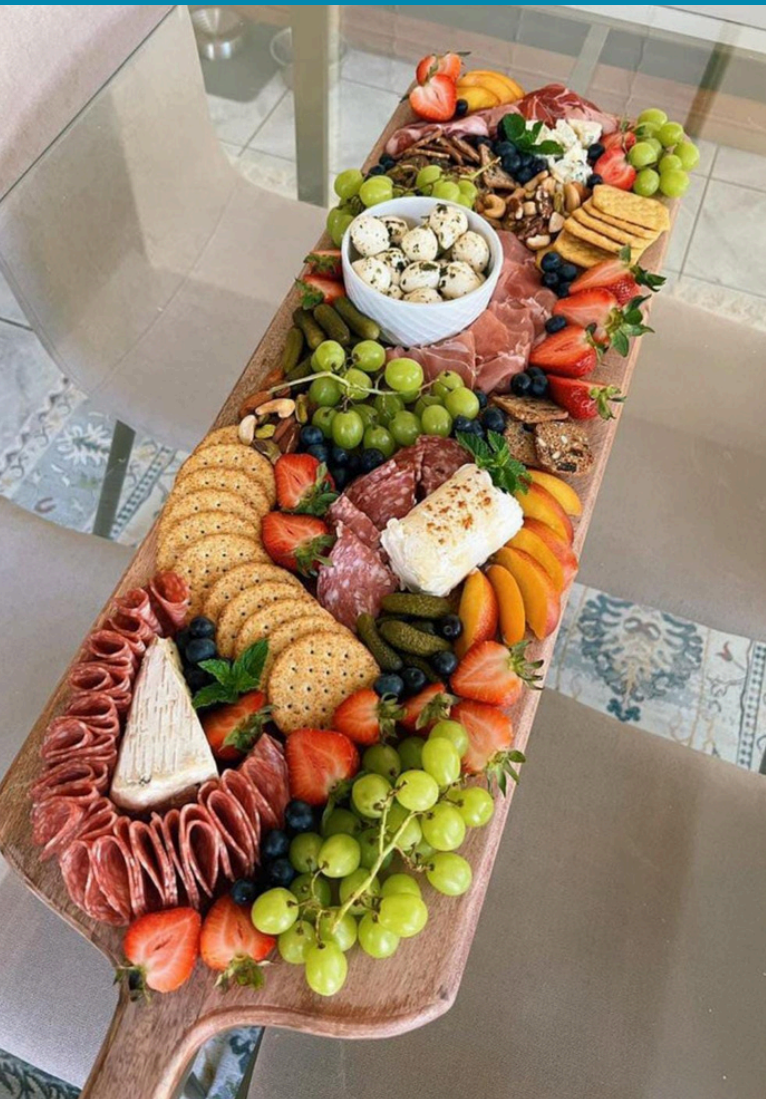
TABLA DE QUESOS Y EMBUTIDOS